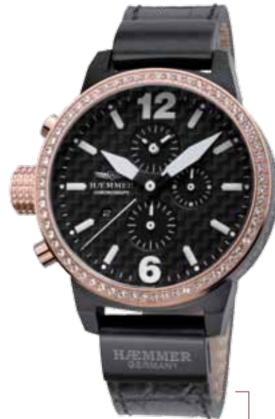
DHC-21 MEDUSA Ø 45 mm

Stainless steel casing, brightly polished IP coating in rose-gold, bezel with Swarovski crystal stones, quartz chronograph, deep-black dial, dark-brown calf leather strap with crocodile embossing