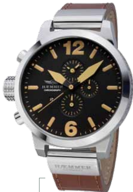
HC-20 SANTAFE Ø 50 mm

Edelstahlgehäuse hochglanzpoliert, Quarz-Chronograph, Zifferblatt in Deep-Black, Kalbslederarmband mit Krokoprägung in Sepia-Brown