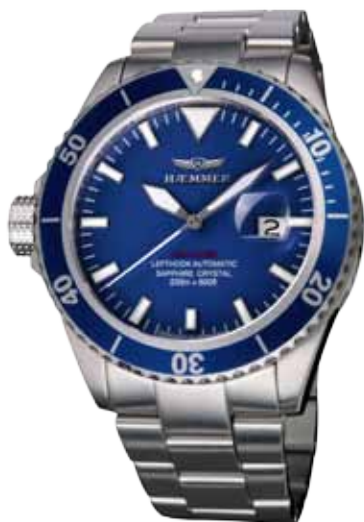
ND-06 OCEANIC Ø 46 mm

Edelstahlgehäuse, Miyota-Automatikwerk, Ziffernblatt in Royal-Blue,, Edelhstahlarmband