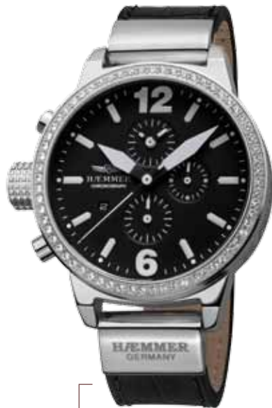
DHC-01 XENIA Ø 45 mm

Edelstahlgehäuse hochglanzpoliert, Lünette mit Swarovski-Steinen, Quarz-Chronograph, Ziffernblatt in Deep-Black, Kalbslederarmband mit Krokoprägung in Deep-Black