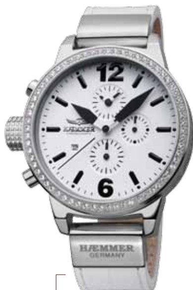
DHC-04 STELLA Ø 45 mm

Edelstahlgehäuse hochglanzpoliert, Lünette mit Swarovski-Steinen, Quarz-Chronograph, Ziffernblatt in Arctic-White, Kalbslederarmband mit Krokoprägung in Arctic-White