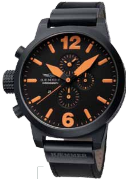
HC-07 INVADER Ø 50 mm

Edelstahlgehäuse IP Gun, Quarz-Chronograph, Ziffernblatt in Deep-Black, Kalbslederarmband in Deep-Black Stainless steel casing - IP coating Gun, quartz-chronograph, deep-black dial, deep-black calf leather strap