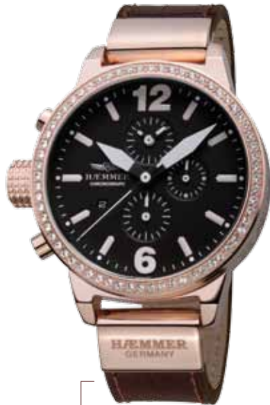
DHC-07 BELLA Ø 45 mm

Edelstahlgehäuse IP Rosegold hochglanzpoliert, Lünette mit Swarovski-Steinen, Quarz-Chronograph, Ziffernblatt in Deep-Black, Kalbslederarmband mit Krokoprägung in Dark-Brown