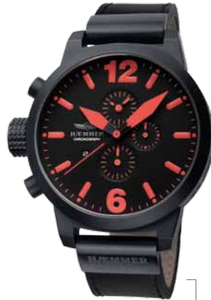
HC-08 TYPHON Ø 50 mm

Edelstahlgehäuse IP Gun, Quarz-Chronograph, Ziffernblatt in Deep-Black, Kalbslederarmband in Deep-Black Stainless steel casing - IP coating Gun, quartz-chronograph, deep-black dial, deep-black calf leather strap