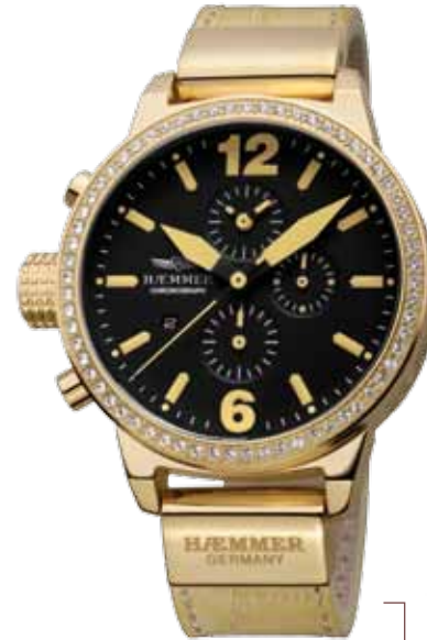
DHC-17 NATALIA Ø 45 mm

Stainless steel casing, brightly polished IP coating in gold, bezel with Swarovski crystal stones, quartz chronograph, deep-black dial, deep-black calf leather strap with crocodile embossing