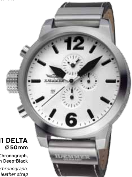
HC-11 DELTA Ø 50mm

The classic HÆMMER chronograph combines progressive design with reliable technology. A harmonious interplay takes place in use and functionality by a striking oversized stainless steel case. In a striking oversized stainless steel case a harmonious ending interplay between place of use and functionality. The clock receives a stylish frame and an elegant calf leather strap with a high quality clasp.