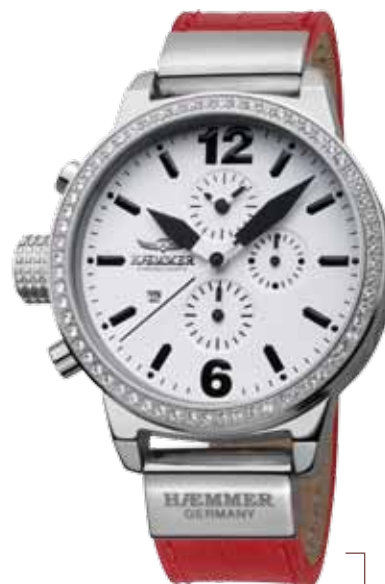
DHC-15 ELECTRA Ø 45 mm

Stainless steel casing, brightly polished, bezel with Swarovski crystal stones, quartz chronograph, arctic-white dial, arctic-white calf leather strap with crocodile embossing