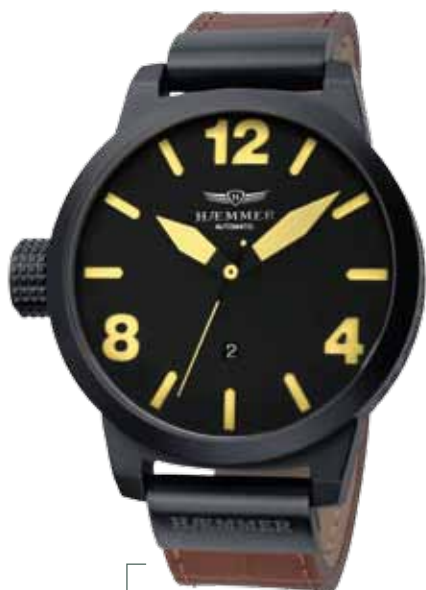
H-14 KRATOS Ø 50 mm

Edelstahlgehäuse IP Gun, Miyota-Automatikwerk, Ziffernblatt in Deep-Black, Kalbslederarmband mit Krokoprägung in Sepia-Brown