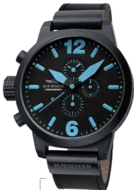
HC-06 NEPTUN Ø 50 mm, 45 mm

Edelstahlgehäuse IP Gun, Quarz-Chronograph, Ziffernblatt in Deep-Black, Kalbslederarmband in Deep-Black Stainless steel casing - IP coating Gun, quartz-chronograph, deep-black dial, deep-black calf leather strap