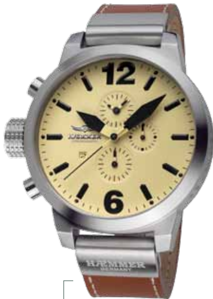
HC-01 FALCON Ø 50 mm, 45 mm

Edelstahlgehäuse, Quarz-Chronograph, Ziffernblatt in Chamois-Beige, Kalbslederarmband in Classic-Brown Stainless steel casing matt, quartz-chronograph, chamois-beige dial, classic-brown calf leather strap