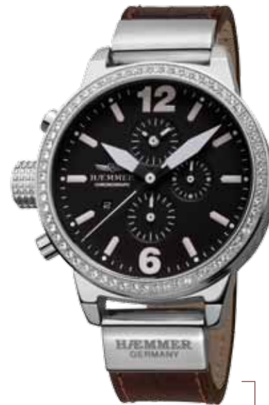
DHC-03 VICENTA Ø 45 mm

Stainless steel casing, brightly polished, bezel with Swarovski crystal stones, quartz chronograph, deep-black dial, deep-black calf leather strap with crocodile embossing