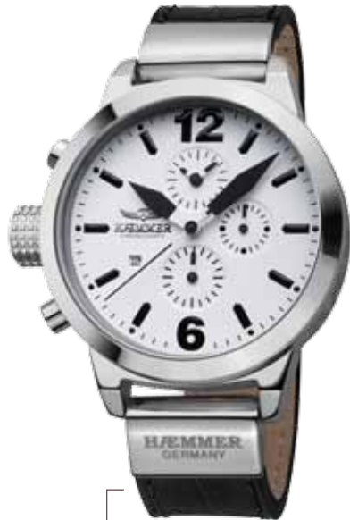
DHC-11 ERGO Ø 45 mm

Edelstahlgehäuse hochglanzpoliert, Quarz-Chronograph, Ziffernblatt in Arctic-White, Kalbslederarmband mit Krokoprägung in Deep-Black