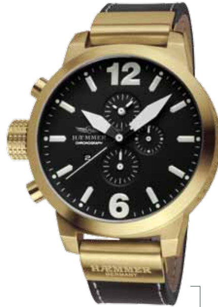
HC-15 PLATON Ø 50 mm

Stainless steel casing - IP coating rose gold, quartz-chronograph, deep-black dial, deep-black calf leather strap