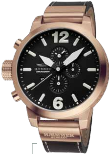
HC-14 EOS Ø 50 mm

Edelstahlgehäuse IP Rosegold, Quarz-Chronograph, Ziffernblatt in Deep-Black, Kalbslederarmband in Deep-Black