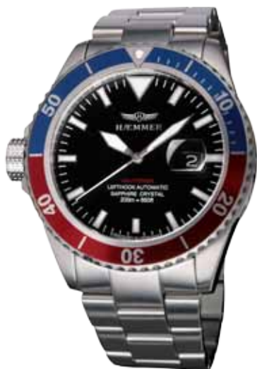
ND-03 ORION Ø 46 mm

Edelstahlgehäuse, Miyota-Automatikwerk, Ziffernblatt in Deep-Black, Edelhstahlarmband