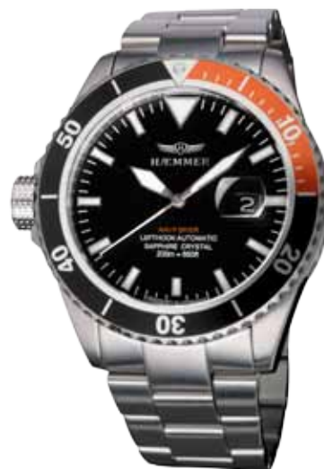
ND-05 ECLIPSE Ø 46 mm

Stainless steel casing, partly polished, Miyota self-winding movement, deep-black dial, stainless steel bracelet