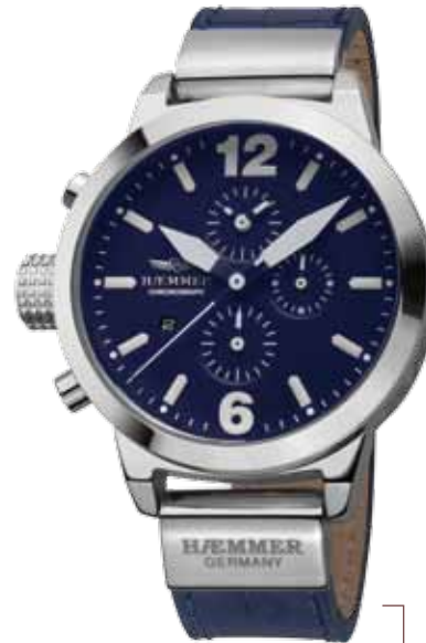
DHC-10 LAGO Ø 45 mm

Edelstahlgehäuse hochglanzpoliert, Quarz-Chronograph, Ziffernblatt in Deep-Black, Kalbslederarmband mit Krokoprägung in Dark-Brown Stainless steel casing, brightly polished, quartz chronograph, deep-black dial, dark-brown calf leather strap with crocodile embossing