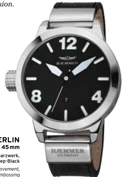
DH-01 BERLIN Ø 45 mm

Make an aesthetic impression with the elegant HÄMMER woman's collection. Best craftsmanship of fine materials, unique design and impressive technology – either as analog or chronograph, in the office or at the next party – a stylish companion for any occasion.