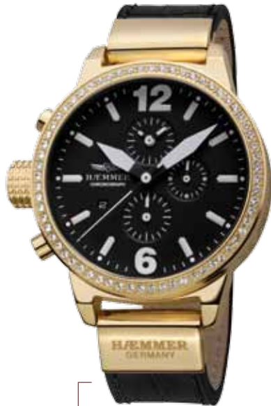
DHC-08 SOLARA Ø 45 mm

Edelstahlgehäuse IP Gold hochglanzpoliert, Lünette mit Swarovski-Steinen, Quarz-Chronograph, Ziffernblatt in Deep-Black, Kalbslederarmband mit Krokoprägung in Deep-Black