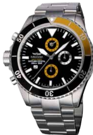
NDC-06 WASP Ø 46 mm

Stainless steel casing, brightly polished, quartz-chronograph, deep-black dial, stainless steel bracelet