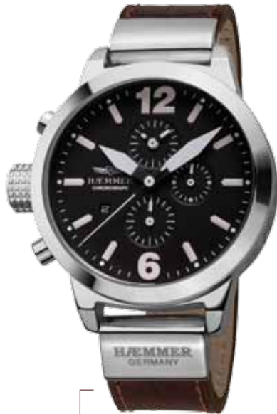
DHC-09 MANON Ø 45 mm

Edelstahlgehäuse hochglanzpoliert, Quarz-Chronograph, Ziffernblatt in Deep-Black, Kalbslederarmband mit Krokoprägung in Dark-Brown Stainless steel casing, brightly polished, quartz chronograph, deep-black dial, dark-brown calf leather strap with crocodile embossing