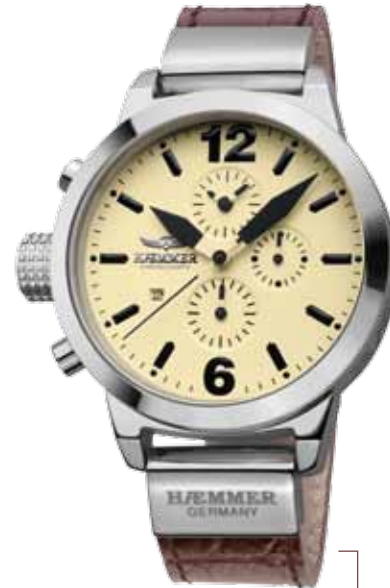
DHC-12 ZENO Ø 45 mm

Stainless steel casing, brightly polished, quartz chronograph, arctic-white dial, deep-black calf leather strap with crocodile embossing