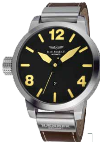
H-03 TERRA Ø 50 mm

Stainless steel casing - IP coating Gun, Miyota self-winding movement, deep-black dial, sepia-brown calf leather strap with crocodile embossing