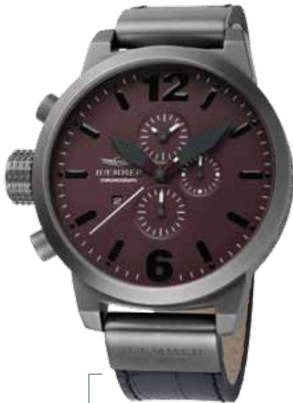
HC-26 COLUMBIA Ø 50 mm, 45 mm

Edelstahlgehäuse IP Titanium, Quarz-Chronograph, Ziffernblatt in Bordeaux-Red, Kalbslederarmband mit Krokoprägung in Deep-Black Stainless steel casing - IP coating Titanium, quartz-chronograph, bordeaux-red dial, deep-black calf leather strap with crocodile embossing