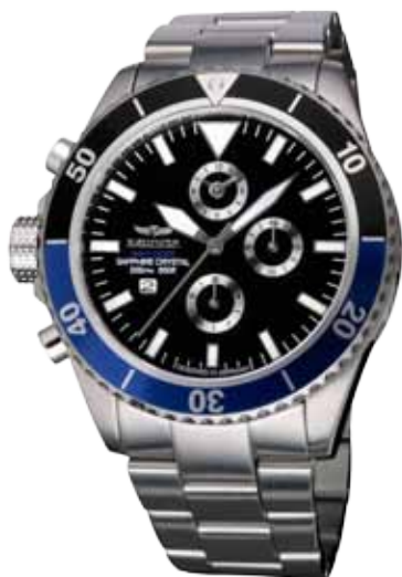
NDC-02 GLADIATOR Ø 46 mm

Edelstahlgehäuse hochglanzpoliert, Quarz-Chronograph, Ziffernblatt in Deep-Black, Edelstahlarmband