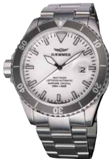
ND-07 ICEMEN Ø 46 mm

Stainless steel casing, partly polished, Miyota self-winding movement, royal-blue dial, stainless steel bracelet