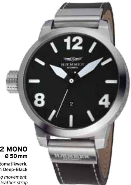
H-02 MONO Ø 50 mm

Traditional watch technology boxed in modern design. The inserted automatic movement combines reliability and durability at a unique composition of the experience of time. The free view of the precise movement and clear visibility of the dial gives the clock an impressive character.