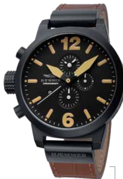
HC-17 ZELOS Ø 50 mm

Stainless steel casing, brightly polished, quartz-chronograph, deep-black dial, sepia-brown calf leather strap with crocodile embossing