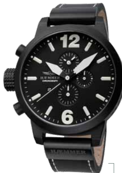
HC-16 CHARON Ø 50 mm

Edelstahlgehäuse IP Gun, Quarz-Chronograph, Ziffernblatt in Deep-Black, Kalbslederarmband in Deep-Black Stainless steel casing - IP coating Gun, quartz-chronograph, deep-black dial, deep-black calf leather strap