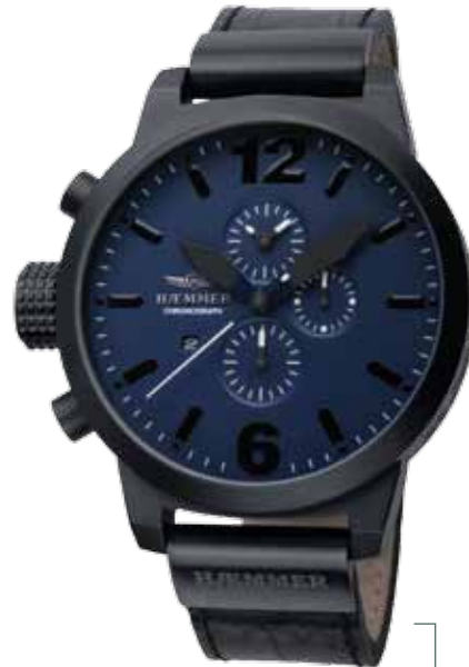
HC-27 HOUSTON Ø 50 mm, 45 mm

Edelstahlgehäuse IP Titanium, Quarz-Chronograph, Ziffernblatt in Bordeaux-Red, Kalbslederarmband mit Krokoprägung in Deep-Black Stainless steel casing - IP coating Titanium, quartz-chronograph, bordeaux-red dial, deep-black calf leather strap with crocodile embossing