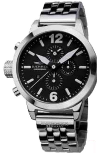
DHC-22 GENUA Ø 45 mm

Stainless steel casing, brightly polished, quartz chronograph, arctic-white dial, stainless steel strap - brightly polished