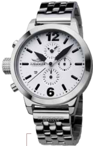
DHC-19 NEREUS Ø 45 mm

Edelstahlgehäuse hochglanzpoliert, Quarz-Chronograph, Ziffernblatt in Arctic-White, Metallarmband aus Edelstahl hochglanzpoliert