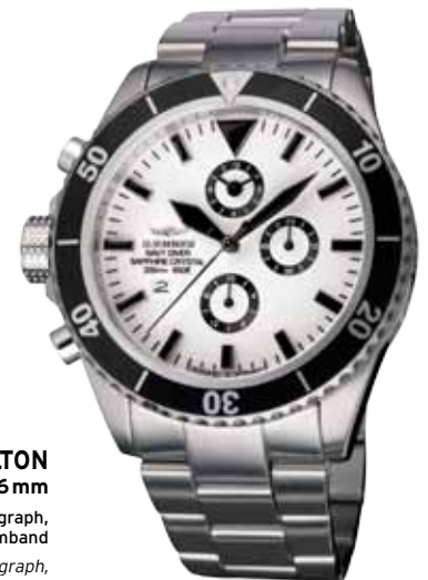
NDC-03 SHELTON Ø 46 mm

Since the patenting of the chronograph function in 1822, the master watchmakers are always developing new models of this kind. HÆMMER is dedicated in manufacturing "oversized" watches, which are unique in appearance and functionality. Large and comfortable, usable in every situation – the future is HÆMMER.