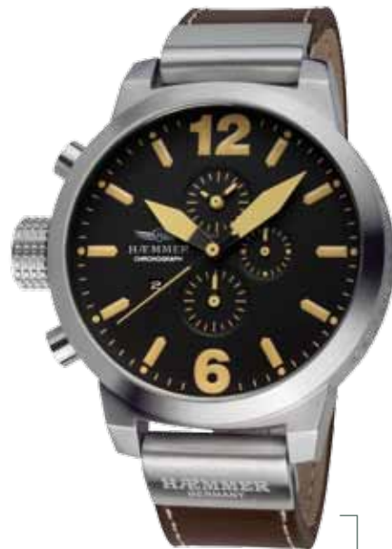
HC-03 DESERT Ø 50 mm

Edelstahlgehäuse, Quarz-Chronograph, Ziffernblatt in Chamois-Beige, Kalbslederarmband in Classic-Brown Stainless steel casing matt, quartz-chronograph, chamois-beige dial, classic-brown calf leather strap